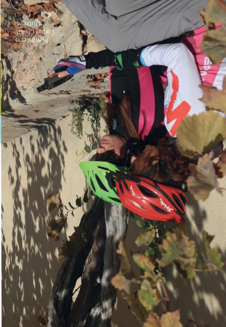
Monasterio Corpus Christi Llutxent